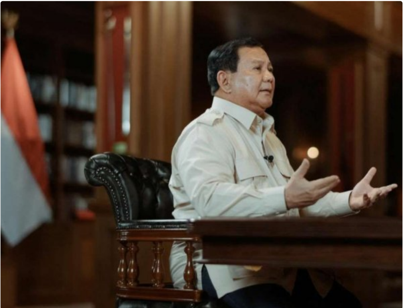
Prabowo Subianto Presiden RI 2024-2029

PENDIDIKAN - Indonesia dikenal sebagai negara yang kaya akan sumber daya alam. Dari hasil tambang yang berlimpah, laut yang luas dengan kekayaan hayati yang melimpah, hutan yang menjadi paru-paru dunia, hingga sumber daya energi yang tersebar di berbagai wilayah, semuanya menjadi kekuatan besar bagi bangsa ini. Potensi besar tersebut seharusnya dapat dimanfaatkan untuk